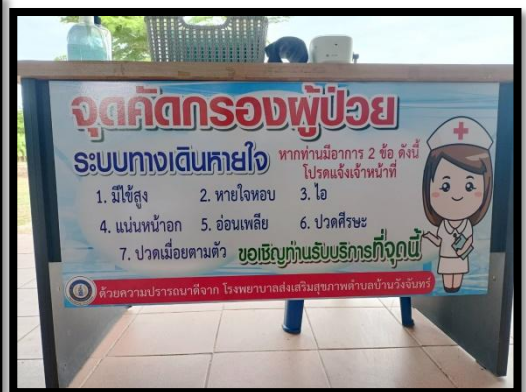
จุดให้บริการ ผู้ป่วยทางเดินหายใจ