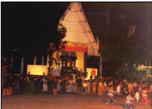
ภาพเมืองตากในอดีตเป็นฉากที่สำคัญ ในการย้อนยุค ให้ผู้ชมเกิดจินตนาการคล้อยตาม