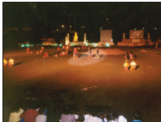
ฉากการคัดเลือกนักมวยในงานสำคัญ ของเมืองตาก เป็นต้นกำเนิดของ พระยาพิชัยดาบหัก