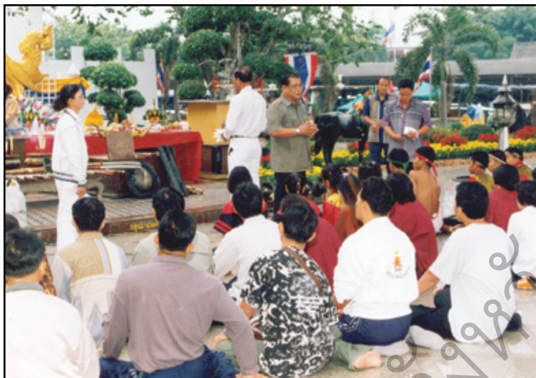
ผู้ร่วมแสดงละครประกอบแสงเสียงประกอบพิธีบวงสรวง ขอพระบรมราชานุญาต สวมบทบาทแสดงเป็นนักรบสมัยโบราณ ในการแสดงละครประกอบแสงเสียง ปี 2543