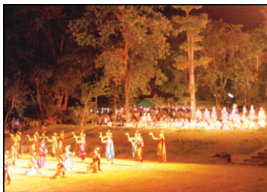
ฉากสุดท้ายของการแสดง จะเป็นการรำยรำ เทิดพระเกียรติสมเด็จพระเจ้าตากสินมหาราช