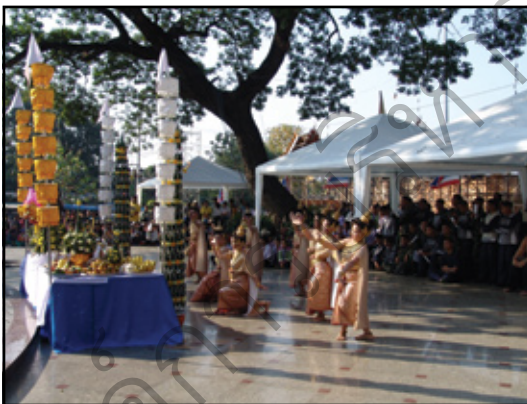
หลังจากฟืนดาบแล้ว นักเรียนโรงเรียนศึกษา สงเคราะห์ตาก รำถวายพระพร