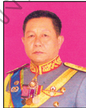
17. พลตรีสัมพันธ์ ศรีราชบัวผัน