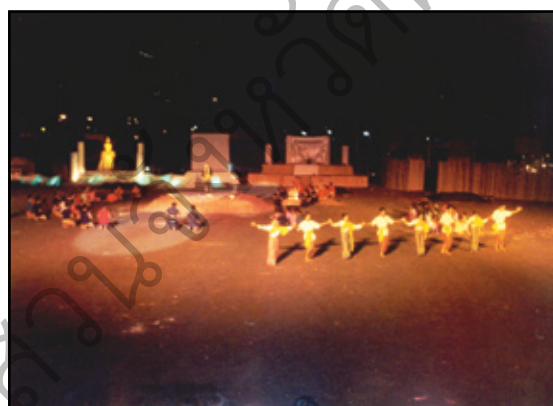
พระยาวชิรปราการและสมเด็จพระเจ้าตากสินมหาราช บทเริ่มต้นการแสดงที่กล่าวถึงความสำคัญ ของพระมหากษัตริย์ ทั้ง 4 พระองค์ ที่เกี่ยวข้องกับเมืองตาก