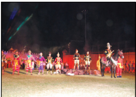
ภาพรวมในองค์ที่ 1 ของการแสดงที่กล่าวถึง พระมหाराช ทั้ง 4 พระองค์ ที่มีพระราชประวัติ เกี่ยวข้องกับเมืองตาก