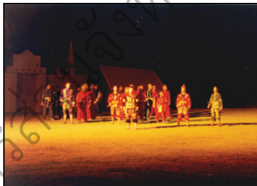
ผู้แสดงสร้างจินตลีลา ตามบทขององค์ต่าง ๆ ที่กำหนดให้เพื่อเพิ่มความเข้มข้นในการแสดง