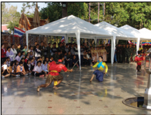
พิธีบวงสรวงขอพระบรมราชานุญาต จัดการแสดง ปีพุทธศักราช 2546 ผู้ร่วมพิธี รำดาบ และฟืนดาบถวาย