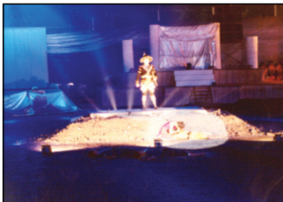
นายอำนาจ สาเขตร์ รับบทแสดงเป็นพระยาดาก