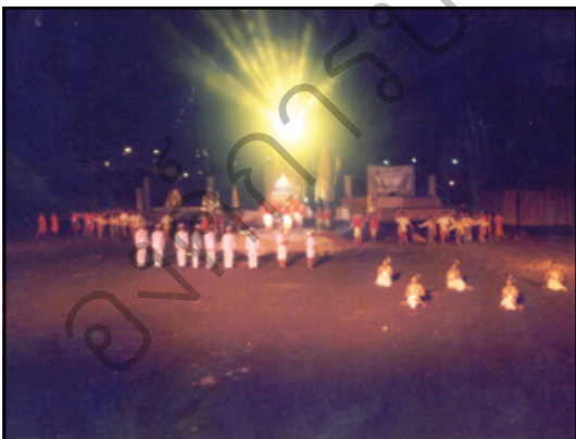
พิธีเปิดการแสดงที่กล่าวถึงความสำคัญ ของกิจกรรมเฉลิมพระเกียรติที่ พระบาทสมเด็จพระเจ้าอยู่หัวภูมิพลอดุลยเดช ทรงมี พระชนมายุครบ 72 พรรษา