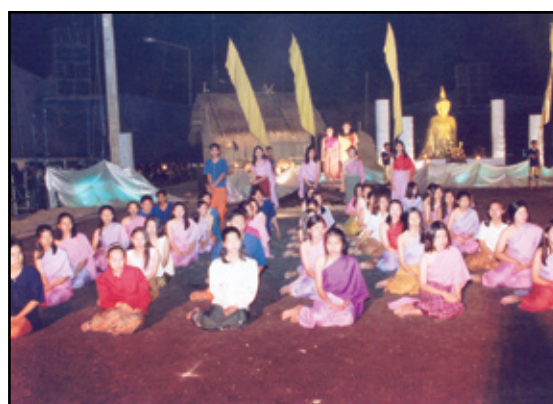
พิธีเปิดฉากการแสดงด้วยความอลังการของ แสง สี เสียง พลุ เอฟเฟคที่สมบูรณ์