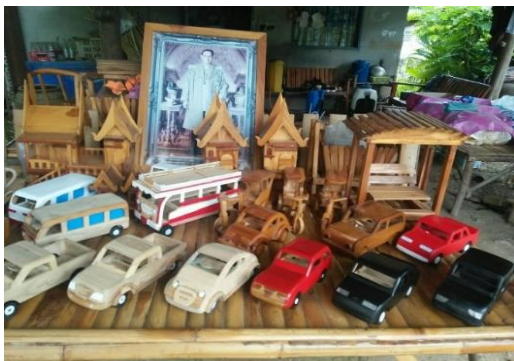
การประดิษฐ์ของเล่นจากไม้