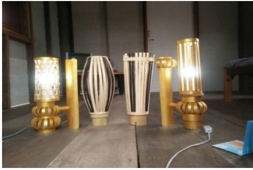
การทำโคมไฟ