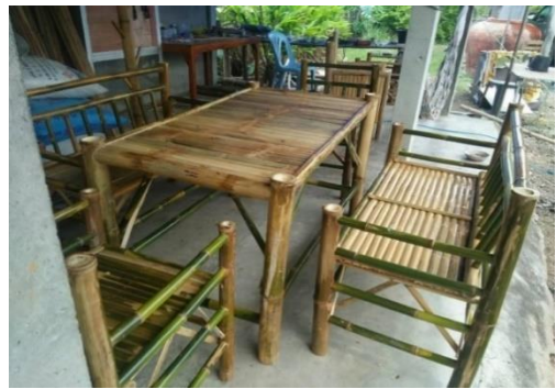
การทำสิ่งของ การทำเก้าอี้จากไม้ไฟ