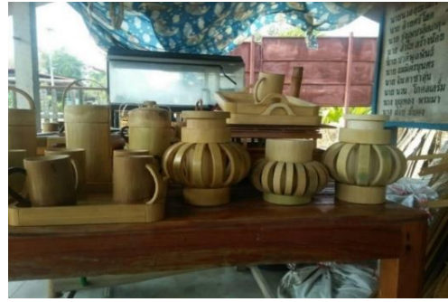
ใช้และตกแต่งบ้านจากไม้ไฟ