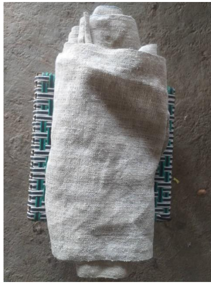
ผ้าที่ทอสำเร็จแล้ว