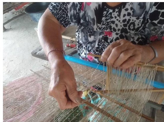
การใส่เส้นด้าย