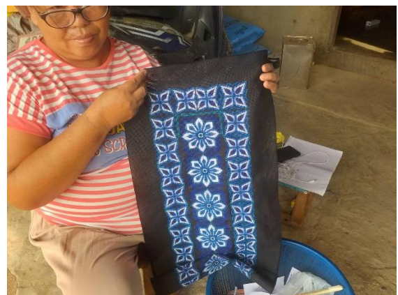
นำผ้ามาย้อมสีธรรมชาติ พร้อมออกแบบลวดลายผ้า และนำผ้ามาปักโดยมีลักษณะลวดลายผ้าตามที่ต้องการ