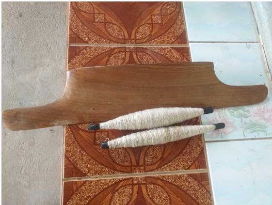
ไม้ทอกระแทบเส้นพุ่ง