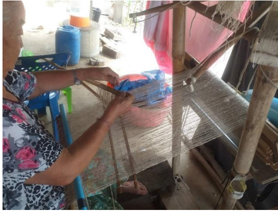
การจับเส้นด้าย