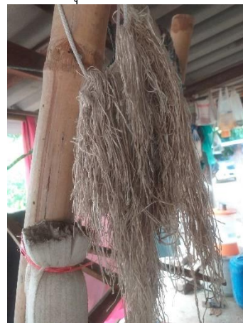
ด้ายเสริมเวลาทอแล้วด้ายขาด