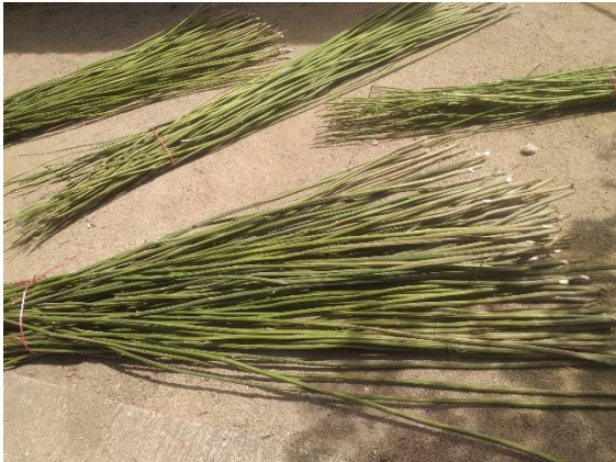
ต้นใยกล้วย