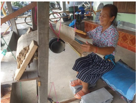
วิธีทอผ้า